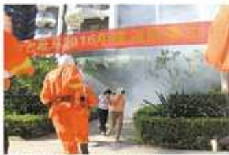
卓达义务消防队消防员对业主进行器材使用培训。

本报讯（记者 袁静 通讯员 曹子康）近日，卓达物业在卓达集团党委的指导下，在社区物业部的指导下，进一步梳理、建立和完善了卓达物业服务体系和制度，建立了卓达物业服务体系和制度，为落实119消防宣传月活动，提高社区消防安全意识，提高居民消防安全意识，提高居民消防安全意识。