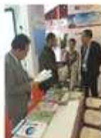
卓达物业展位展示。