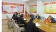
伊萍党支部在组织学习。

小树涂白不是一天就能完成的，三三期小区小树涂白也不是一天就能完成的。小树涂白不是一天就能完成的，三三期小区小树涂白也不是一天就能完成的。