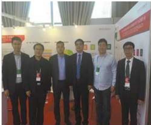
卓达物业领导团队在博览会现场合影。