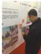
工作人员接待参观者。

本报讯(李彦博)11月24日-30日,为期7天的首届物业产业博览会暨第二届中国物业管理创新发展论坛,在广州市琶洲国际会展中心拉开帷幕。卓达物业总经理、中国物业管理协会副会长李彦博应邀出席。