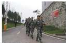
卓达物业团队在园区项目现场。

本报讯(李彦博)2016年11月30日,卓达物业承接四川首个园区类服务项目,标志着卓达物业在四川市场的发展迈出了重要一步。该项目位于四川省成都市,由卓达物业承接。项目总建筑面积10万平方米,卓达物业承接该项目,标志着卓达物业在四川市场的发展迈出了重要一步。卓达物业承接该项目,标志着卓达物业在四川市场的发展迈出了重要一步。卓达物业承接该项目,标志着卓达物业在四川市场的发展迈出了重要一步。