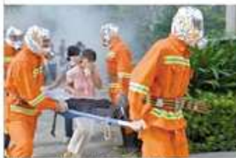
卓达物业义务消防队进行火灾初期的灭火扑救。