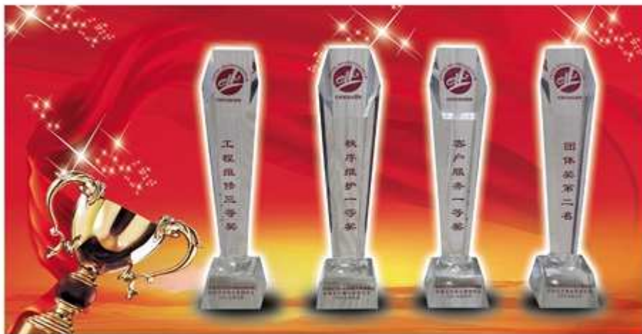
详见 B、C 版